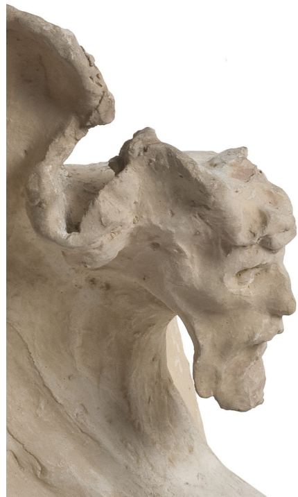
Pierre Roche, détail Loïe Fuller dansant dans Salomé , plâtre patiné, musée Camille Claudel © Musée des Arts décoratifs