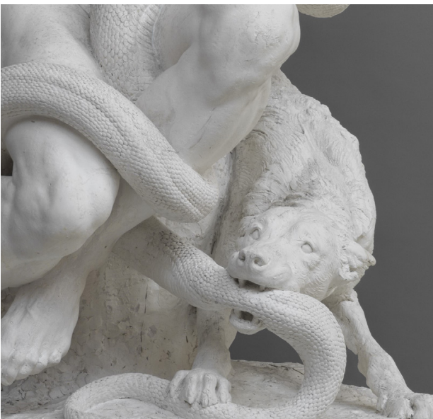
Gabriel-Jules Thomas, détail L'Âge de pierre , plâtre, musée Camille Claudel

Ils observent la matérialité des sculptures. La lumière modifie la vision d'une même sculpture.