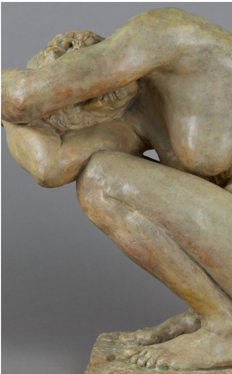
Camille Claudel, Femme accroupie , plâtre patiné, musée Camille Claudel

Face aux sculptures, les élèves reculent ou s'approchent pour voir des détails qui les intriguent :