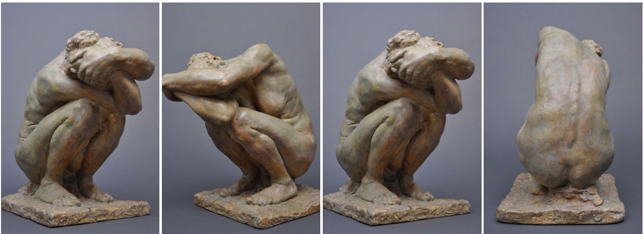
Camille Claudel, Femme accroupie , plâtre patiné, musée Camille Claudel

Ils se déplacent autour de la sculpture pour l'observer de plusieurs points de vue, privilégiant ainsi la singularité d'un regard.