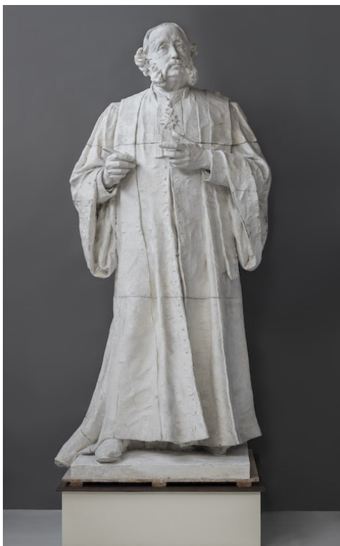
Alfred Boucher, Monument au docteur Ollier , hauteur : 3,65m, plâtre, musée Camille Claudel

Dans le musée, les élèves se confrontent aux vraies dimensions des sculptures, car celles-ci peuvent être minuscules ou monumentales.