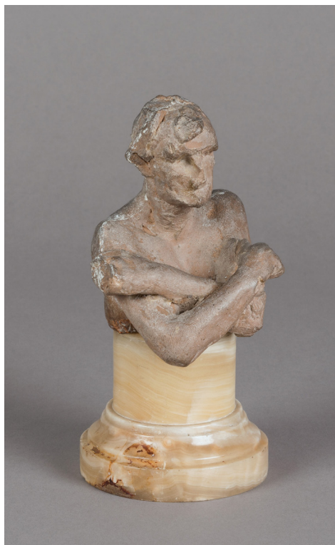
Camille Claudel, L'Homme aux bras croisés , hauteur : 10cm, plâtre, musée Camille Claudel